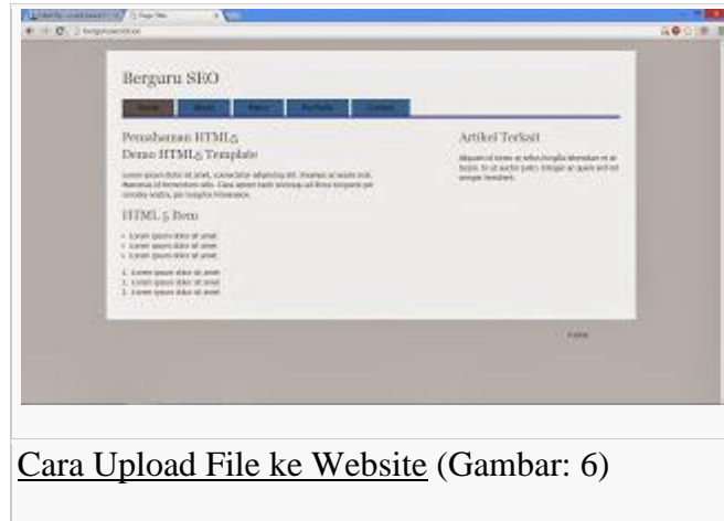
Cara Upload File ke Website (Gambar: 6)

Kami adalah sekelompok orang yang sadar akan pentingnya ilmu :: Orang lain bisa saja berfikir sebaliknya :: Mungkin juga sejalan dengan pemahaman kami :: Ini sangat tergantung sudut pandang sebuah ilmu :: Tetapi bagi kami tidak ada kata lain :: Menguasai ilmu adalah segalanya :: Entah sampai kapan kami memegang prinsip ini :: Namun kami yakin bahwa segalanya butuh ilmu :: Indonesia harus menjunjung ini setinggi tingginya :: Lembaga terkait harus mampu mendukung sepenuh hati :: Majukan anak bangsa dari sisi kecerdasan :: Untuk bekal kemandirian dan kemajuan serta kebesaran bangsa :: Tekad kami kedepan adalah pasti :: Ilmu harus bisa diciptakan dan digunakan bersama :: Jika kami sadar ilmu datang dan hadir bukan karena kami ciptakan :: Untuk sebaliknya kami pun sadar ilmu datang dan hadir diciptakan untuk kami :: Namun ilmu harus terus dilakukan pengkajian, penelitian, pengembangan, pengabdian :: Akhir nya ilmu pun harus mendapat pengakuan dan manfaat :: Ilmu kami tidak hanya berfikir sebatas apa yang kami ketahui dan dapat kami lakukan :: Dan lebih jauh dari itu kami berfikir tentang apa yang tidak kami ketahui dan tidak dapat kami lakukan :: Ilmu kami tidak hanya mencapai batas maksimal kemampuan, lebih jauh dari itu kami harus berfikir menembus batas, hingga diluar batas maksimal kemampuan