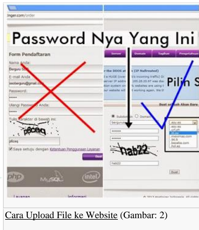
Cara Upload File ke Website (Gambar: 2)

* yang dimaksud password disini adalah password saat Anda mengisi SubDomain, jadi bukan password saat Anda membuat akun IDHostinger.