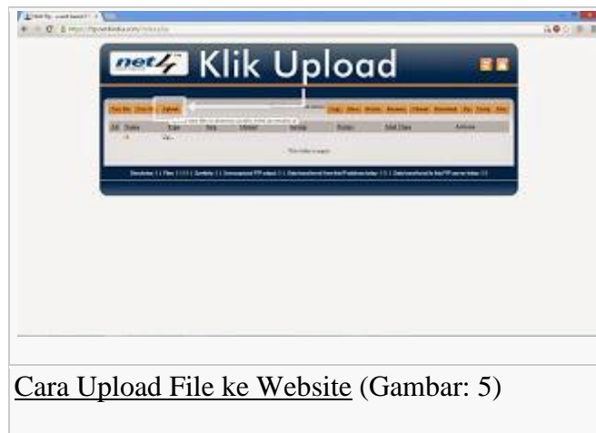
Cara Upload File ke Website (Gambar: 5)