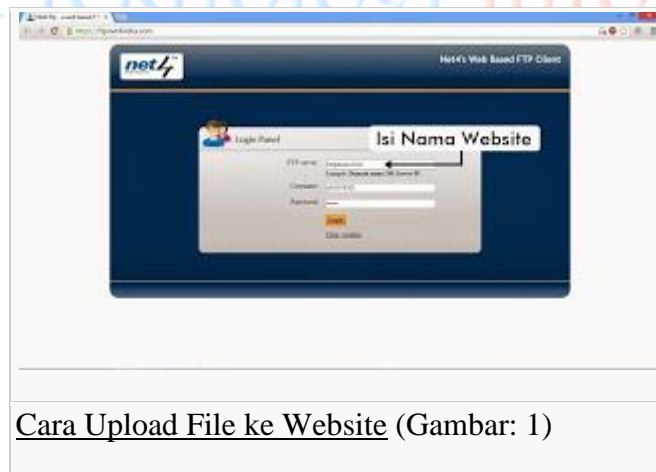
Cara Upload File ke Website (Gambar: 1)