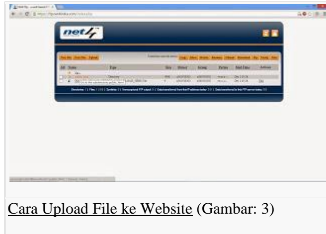
Cara Upload File ke Website (Gambar: 3)