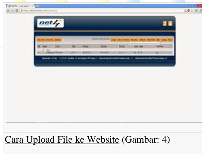
Cara Upload File ke Website (Gambar: 4)